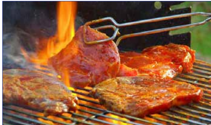
Catering Live Barbecue für alle Sinne Ihrer Gäste

Unsere Catering Grillbuffets sind individuell und exklusiv für Ihre Feier möglich. Das Live Barbecue (vor Ort gegrillt) wird Ihre Gäste begeistern und Sie entlasten, denn Sie möchten sich nicht um den Grill, sondern um Ihre Gäste kümmern und vom Grillexperten verwöhnt werden. Natürlich mit verschiedenen wunderbar marinierten Fleischsorten. Auch für Vegetarier zaubern wir schmackhafte Grillspieße.