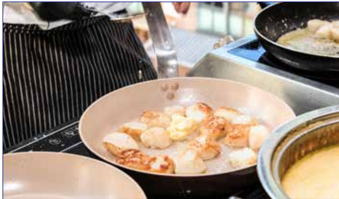
Catering Live Cooking vor den Augen der Gäste

Dabei werden Ihre Gäste vom Duft der Jakobsmuscheln angezogen und bekommen Appetit für das leckerste Catering. Ihre Gäste werden begeistert und Ihr Fest wird lange in aller Munde sein.